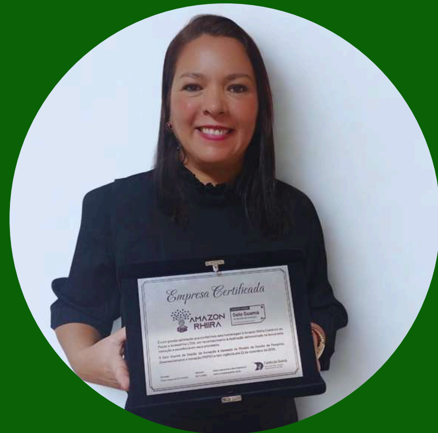
Parque de Ciência e Tecnologia/PA Selo de Gestão de Inovação Guamá 2024