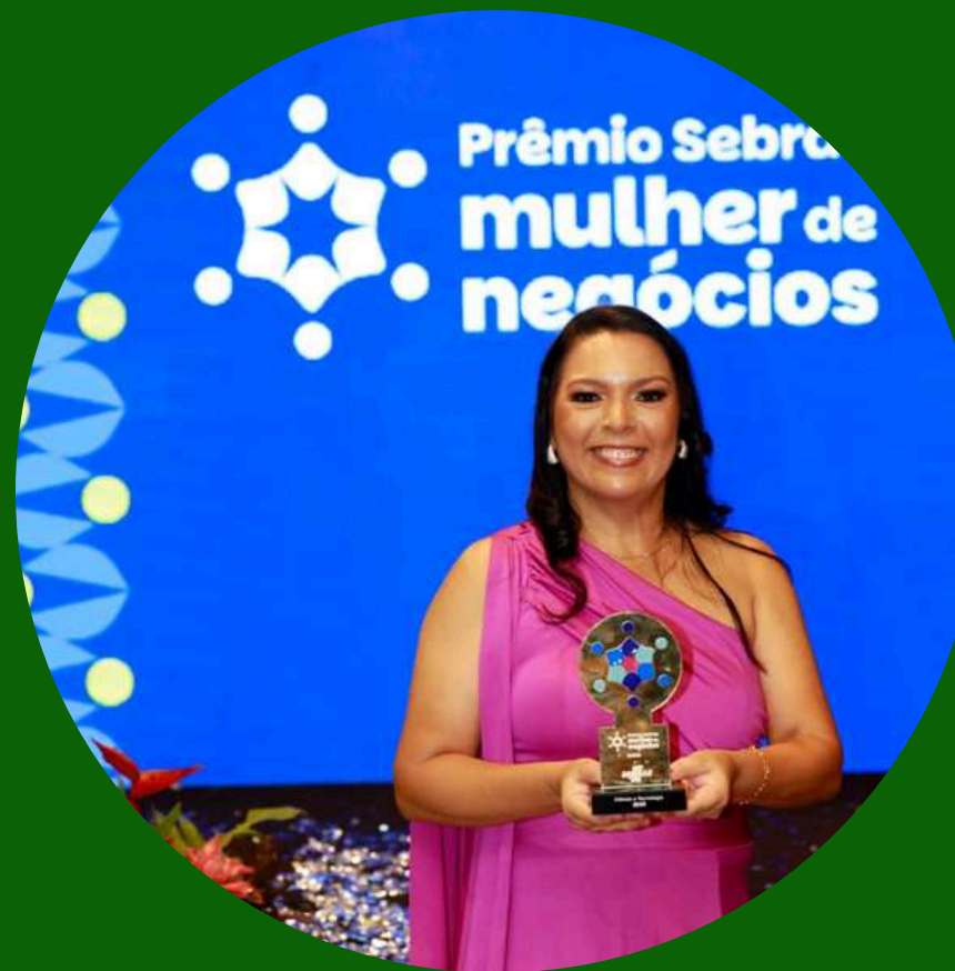
Prêmio Sebrae Mulher de Negócios 2025 1º lugar Categoria Ciência e Tecnologia