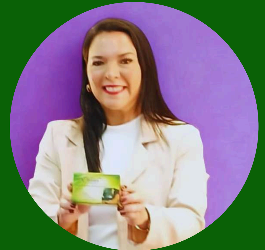
Prêmio FIEPA 2025 1º lugar Categoria Especial em Setores Intensivos em Carbono